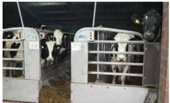
Ausgedient: letzte Tage im alten Stall