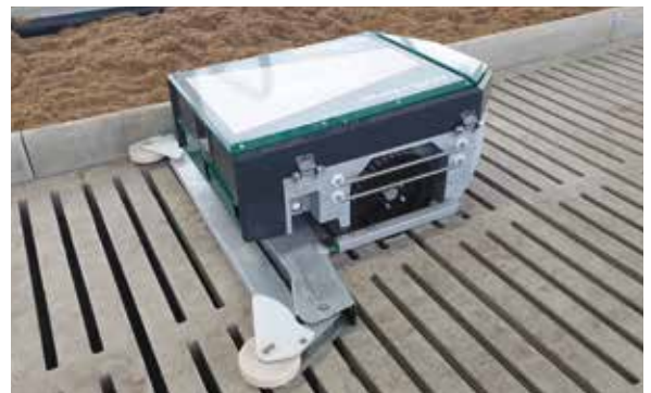
Sauber: GEA SRone+ mit Spray