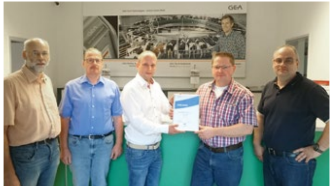
Wessinghage GmbH & Co. KG, 59510 Lippetal-Lippborg/49328 Melle-Bruchmühlen