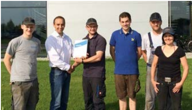
Neyer Landtechnik GmbH, 88339 Bad Waldsee

Die Mitarbeiter in den GEA Fachzentren geben jeden Tag ihr Bestes, um Sie rundum zu unterstützen. Und weil wir für Sie noch besser werden möchten, haben wir erneut zwei Fachzentren zum ExpertCare-Zentrum schulen und zertifizieren lassen. Herzlichen Glückwunsch!